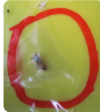
Adulto di scafoideo su trappola cromotattica